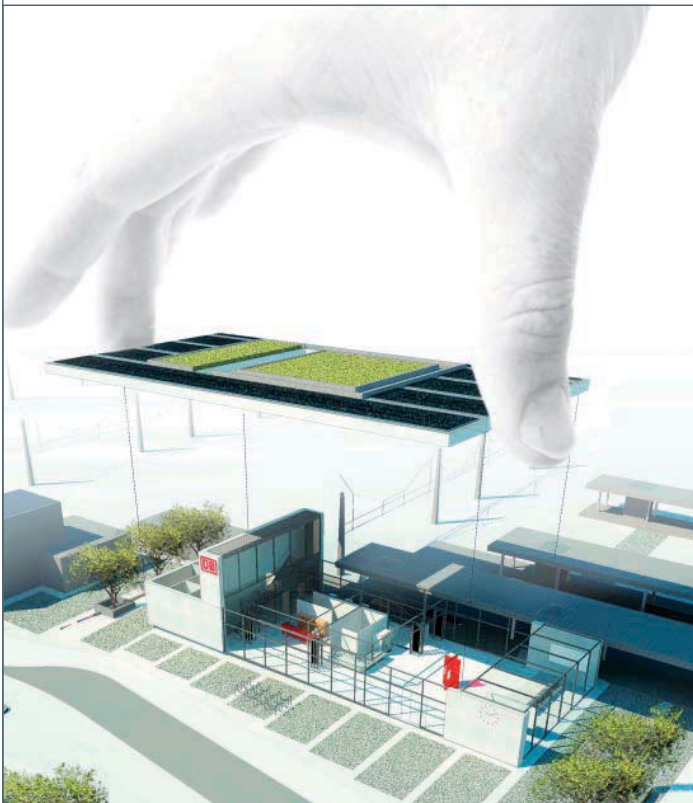
BILD 1: Vogelperspektive des „Grünen Bahnhof Horrem“

Die Fassadenflächen reagieren in ihrer Materialität auf die regionalen Anforderungen. In Horrem wird die Fassade aus lokalem Schiefer ausgeführt während die Pläne für Wittenberg eine Klinkerfassade vorsehen (Bild 3). Durch die Materialien aus der jeweiligen Region wird ein Bezug zu der lokalen Bautradition